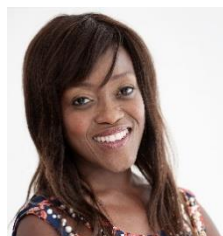
Maurizio Battino Italy Int J Mol Sci 主编 J Berrv Res 主编