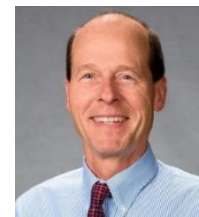
Bernhard Hennig USA J Nutr Biochem 主编